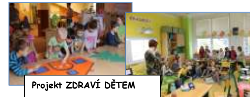
Projekt ZDRAVÍ DĚTEM