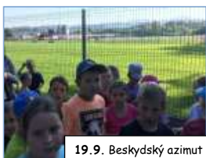
19.9. Beskydský azimut mládeže - závody v orientačním běhu

Přejeme všem krásné prožití Vánočních svátků - Wszystkim z serca życzymy wesołych Świąt Bożego Narodzenia