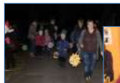
31.10. Lampionový průvod a dílničky v MŠ