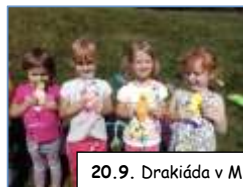
20.9. Drakiáda v MŠ