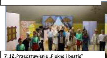
7.12. Przedstawienie „Piękna i bestia“