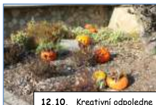
12.10. Kreativní odpoledne s dýněmi v ŠD