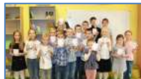
23.10. Świąt o poezji