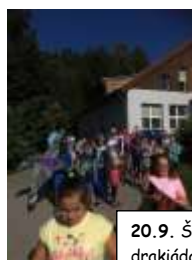
20.9. Školní drakiáda