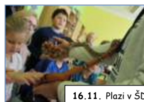
16.11. Plazi v ŠD