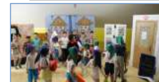
30.11. Představení „At' žijí duchové“