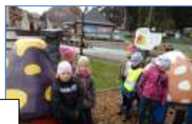
3.10. Celodenní výlet MŠ do areálu Bílá v Beskydech