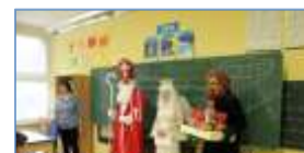
6.12. Návštěva Mikuláše - Odwiedziny Mikołaja