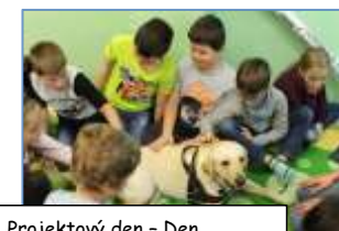
9.11. Projektový den - Den mazlíčků + ukázka canisterapie