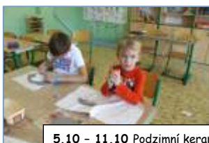
5.10 - 11.10 Podzimní keramické dílny/Jesienne warsztaty ceramiczne